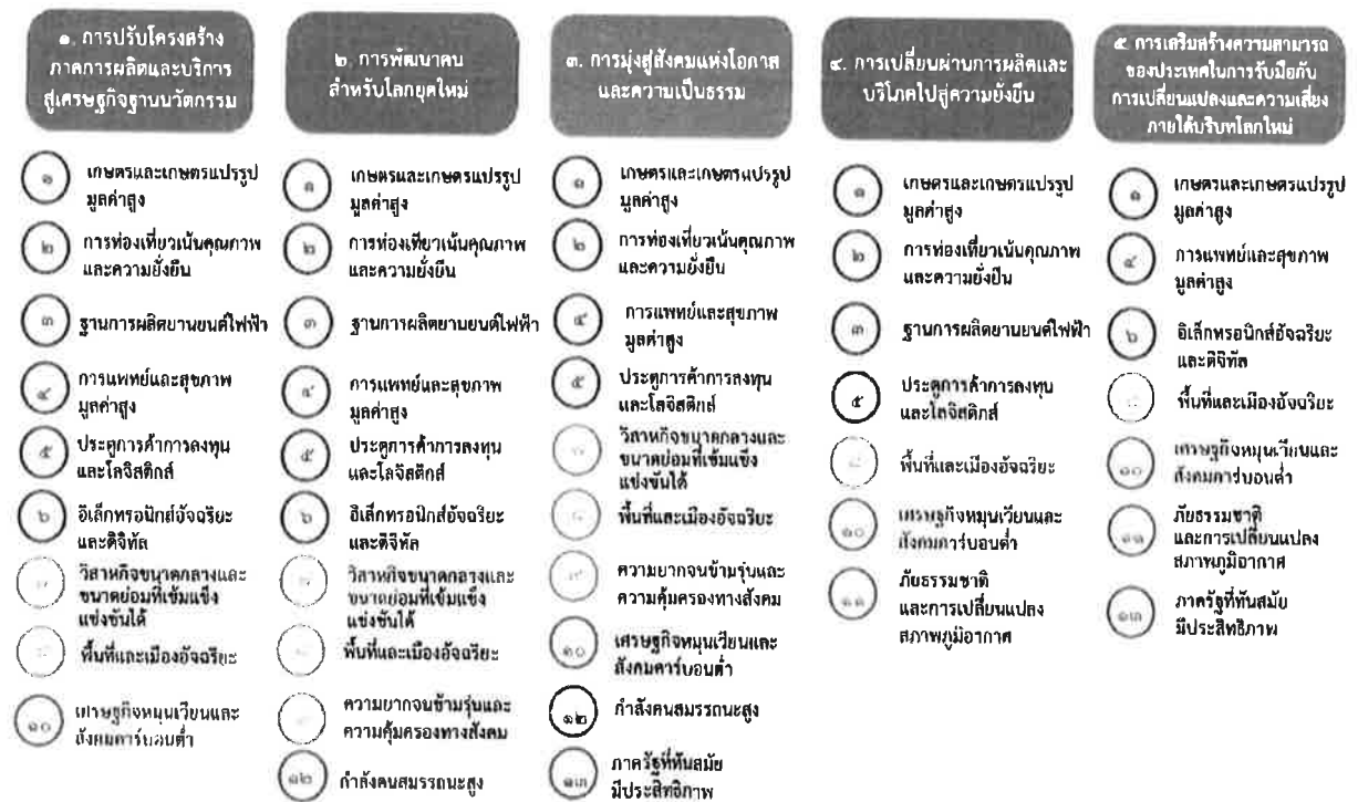
แผนภาพที่ ๓.๑ ความเชื่อมโยงระหว่างหมวดหมู่การพัฒนา กับเป้าหมายหลัก

ความเชื่อมโยงระหว่างหมวดหมู่การพัฒนา กับเป้าหมายหลักแสดงไว้ในแผนภาพที่ ๓.๑ โดยหมวดหมู่ การพัฒนาที่กำหนดขึ้นเป็นประเด็นที่มีลักษณะเชิงบูรณาการที่ครอบคลุมการพัฒนาตั้งแต่ในระดับต้นน้ำจนถึง ปลายน้ำ และสามารถนำไปสู่ผลพัฒนาทั้งในมิติเศรษฐกิจ สังคม ทรัพยากรธรรมชาติและสิ่งแวดล้อมไปพร้อมๆ กัน ทำให้หมวดหมู่แต่ละประการสามารถสนับสนุนเป้าหมายหลักได้มากกว่าหนึ่งข้อ นอกจากนี้การพัฒนาภายใต้ แต่ละหมวดหมู่ไม่ได้แยกขาดจากกัน แต่มีการสนับสนุนหรือเอื้อประโยชน์ซึ่งกันและกัน